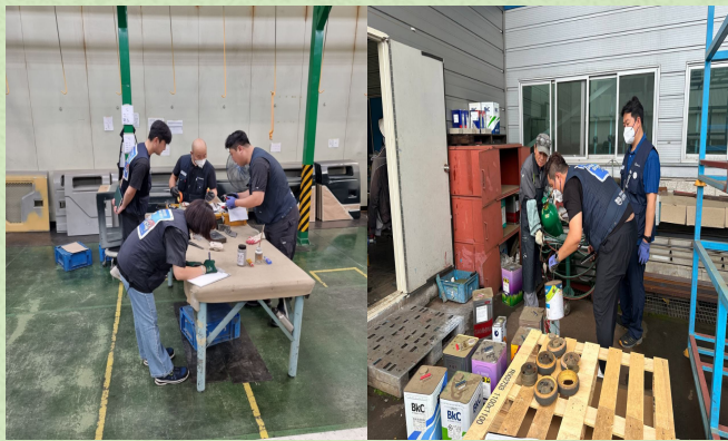
▲ 현장조사하는 모습

2024년 경주지부는 7차 발암물질 조사사업 (현장조사)을 지난 6월 24일 ~ 28일 1주일간 진행하였다. 2023년 지부집단 합의사항에따라 이번 조사사업 현장조사는 명성공업지회, 발레오만도지회, 현대성우슬라이트지회, 우영산업 천안,광주 지회에 대하여 조사를 진행하였으며 그 외 사업장의 경우 2023년 미흡부분에 대하여 msds확보등에 중점을 두며 사업을 전개하였다. 이번 본조사사업시 사업장에서 사용중인 신너 샘플 채취하여 벤젠성분에 대한 분석을 의뢰하였으며 일부 사업장의 경우 벤젠 성분 함량이 0.8% 검출됨을 확인할 수 있었다. 결과에 따라 해당사업장은 대체 물질등의 조치를 취하였으며 전체적인 사업결과 보고회는 10월중 계획을 하고있다.