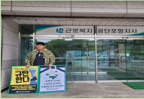
▲ 근로복지공단 1인시위