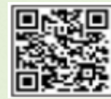
체감온도 계산 및 확인방법

○체온 38도 이상 고열, 건조하고 뜨거운 피부, 근육경련, 많은 땀 등