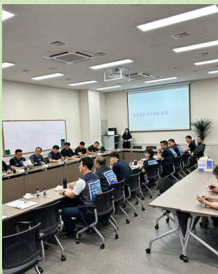
▲ 현장조사 후 브리핑