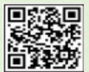
체감온도에 따른 폭염 단계별 대응요령