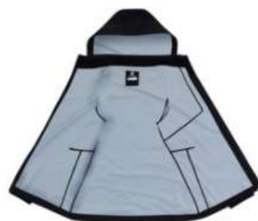
2.5 레이어 고기능성 방수원단