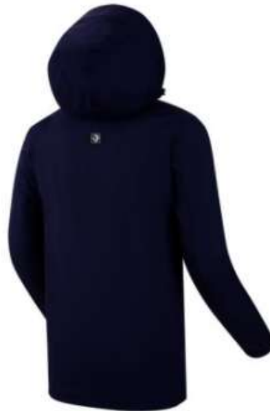
메인+가슴 포켓 방수지퍼