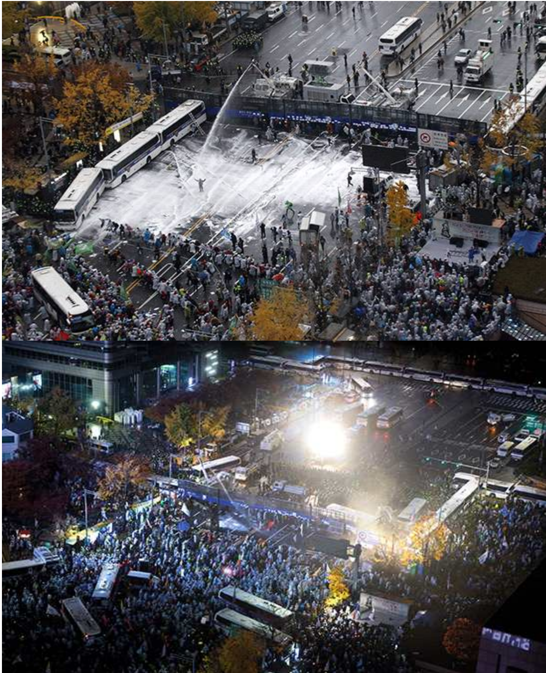
[차벽을 사이에 둔 모습, 위 - 한겨레, 아래 - 시사인 사진]

- 앞서 사진으로 제시한 바와 같이 경찰은 불허된 집회의 개최를 막기 위해 광화문으로 통하는 길목을 경찰버스로 완전히 막고, 세종로 사거리에는 벽처럼 생긴 구조물을 설치하였음. 시위대는 경찰버스에 밧줄을 묶어 끌어당기는 방법으로 이를 이동시켰음. 그러나 벽처럼 생긴 구조물의 경우에는 이동시킬 방법이 없는 것으로 보였음(감시단이 관찰하기에는 실제로 이동시키려는 시도 자체도 거의 없는 것으로 보였음). 구조물이나 차량에 사다리를 이용해 올라가려는 시도도 있었으나, 차량 지붕에 이미 경찰이 대기중이었기에 그러한 시도는 거의 진압된 것으로 보임